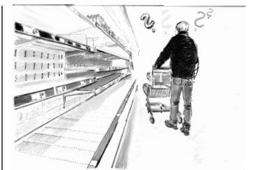
„Wieso fehlen die Lebensmittel?“

sicherstellungs- und -vorsorgegesetz), ist laut Behörde angepasst an veränderte Rahmenbedingungen und Gefährdungsszenarien. Die Umsetzung soll über entsprechende Verordnungen praktiziert werden. Dieses Vorgehen öffnet einer behördlichen Willkür Tür und Tor und könnte diesmal der deutschen Bauernschaft und Selbstversorgung den Todesstoß versetzen und dadurch Deutschland in die totale Abhängigkeit von internationalen Großkonzernen stürzen. [3]